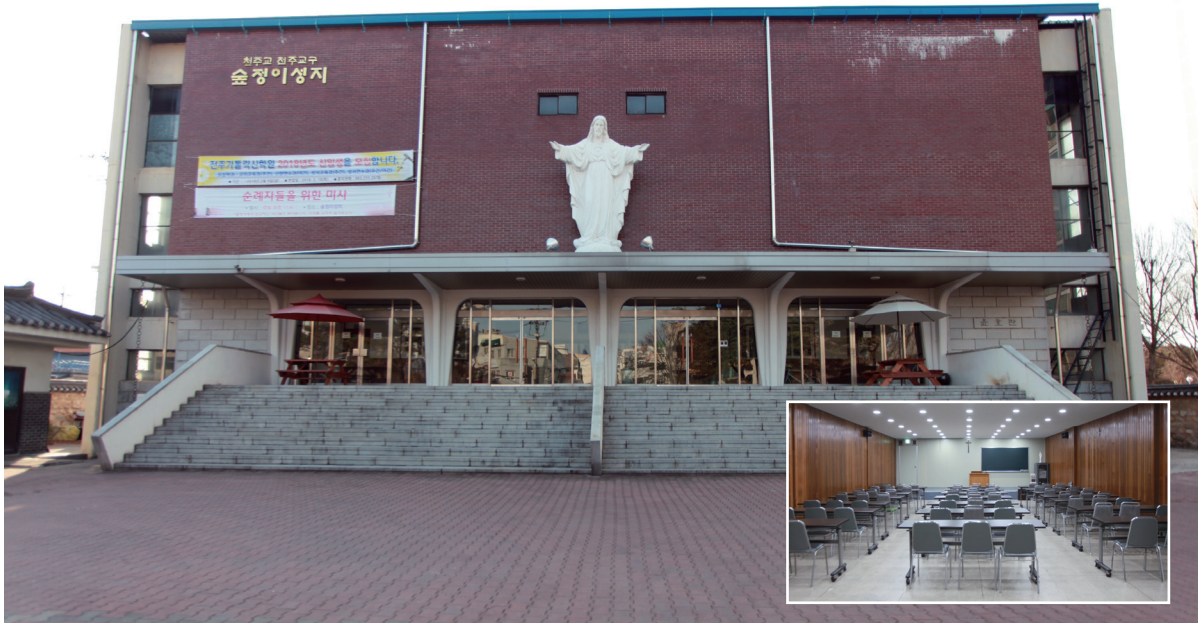
전주가톨릭신학원 | 성전(聖傳)과 성경(聖經)에 담긴 '신앙의 유산'에 대하여 배울 수 있는 교리부와 성서부의 교육과정(2년)을 마련하여, 교리교사와 말씀봉사자를 양성하는 교육기관이다. / 문의 : 063)255-2678